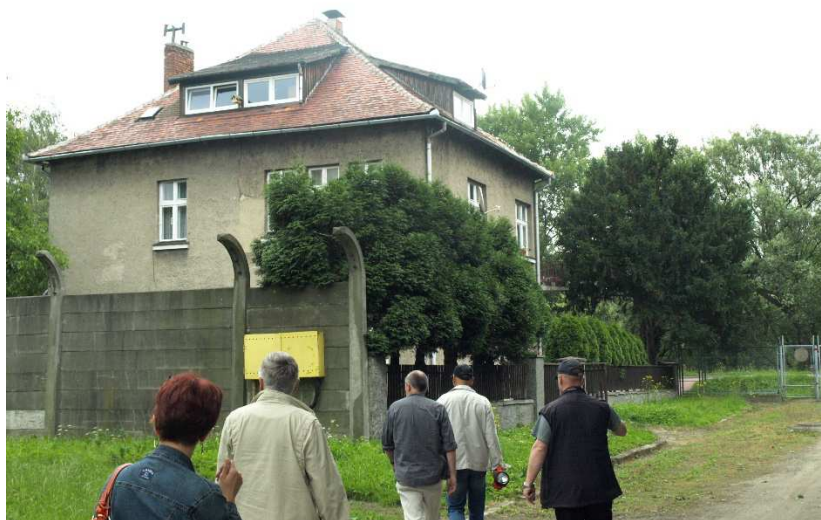
Willa komendanta obozu

Problemem holocaustu zajmuje się obecnie Instytut Yad Vashem w Jerozolimie, który zgromadził największą ilość materiałów historycznych oraz zeznań świadków.