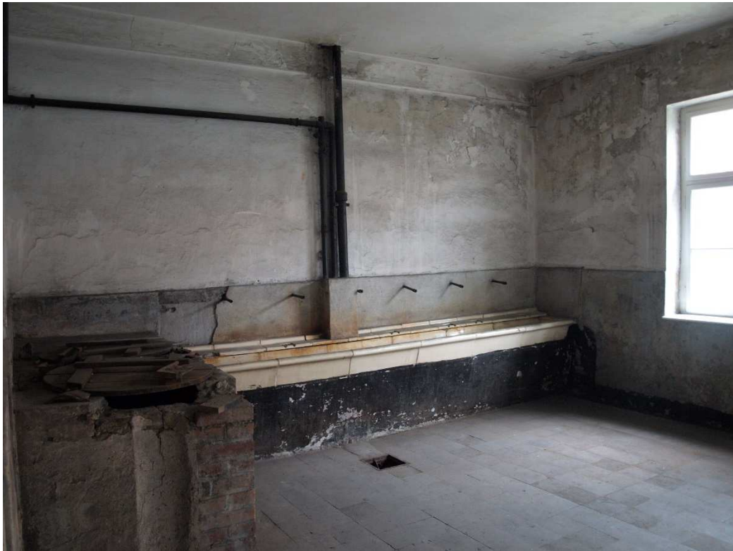
Pozostałości po łazience w Auschwitz I