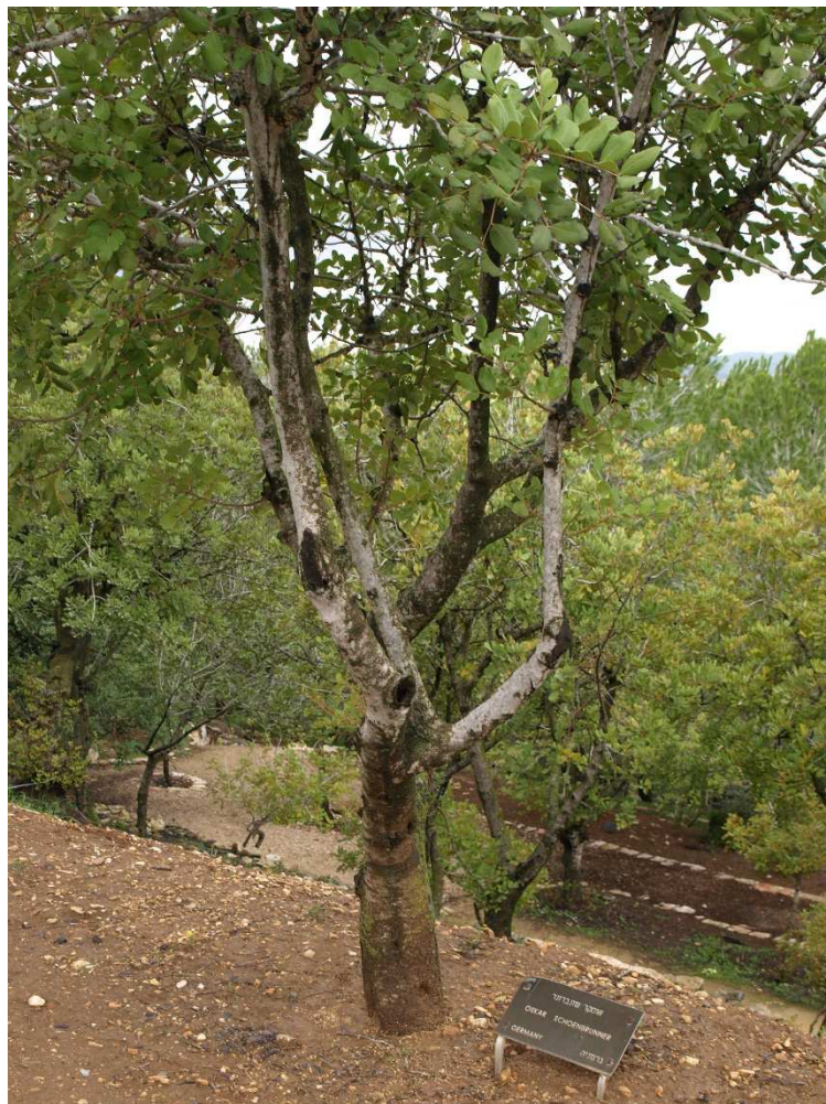
Drzewko Sprawiedliwych – upamiętnienie tych, którzy bezinteresownie ratowali Żydów z holocaustu