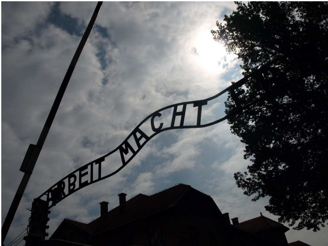
Auschwitz I – brama obozowa