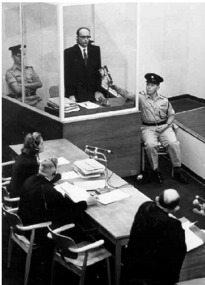
Zdjęcie z procesu twórcy holocaustu – Adolfa Eichmana, czerwiec 1962