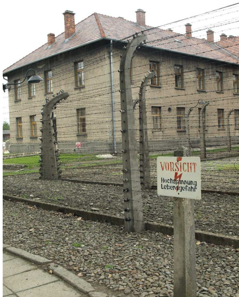
Ogrodzenie obozu, pierwotnie pod napięciem

Największym z ponad 40 obozów i podobozów wchodzących w skład kompleksu obozów Auschwitz był obóz Auschwitz-Birkenau.. W czasie 3 lat istnienia pełnił on szereg funkcji: zaczęto go budować w październiku 1941 r. jako obóz dla około 125 000 jeńców wojennych, uruchomiono w marcu 1942 r. jako filię KL Auschwitz, przy czym pełnił równocześnie funkcję ośrodka zagłady Żydów. W ostatniej fazie istnienia, od 1944 r. stał się również miejscem koncentracji więźniów przed przeniesieniem ich do pracy dla niemieckiego przemysłu w głębi Trzeciej Rzeszy. W obozie tym zginęła większość, przypuszczalnie około 90% ofiar, a zatem około 1 mln ludzi; w zdecydowanej większości (ponad 90%) byli to Żydzi. Ponadto w obozie tym zginęła znaczna część z około 70 000 Polaków zmarłych i zabitych w kompleksie obozów Auschwitz, około 20 000 Cyganów, oprócz nich jeńcy radzieccy i więźniowie innych narodowości. Pierwsze projekty i plany obozu przewidywały początkowo umieszczenie w obozie 100-125 000 ludzi. W 1942 roku koncepcja ta uległa kilkakrotnie zmianie – przyjęto mianowicie, że obóz ten będzie ostatecznie mieścił dwukrotnie więcej, bo 200 000 osób. Według tych planów obóz miał się dzielić na cztery części zwane odcinkami budowlanymi oznaczonymi kolejnymi cyframi rzymskimi: pierwszy odcinek budowlany miał mieścić 20 000 ludzi a pozostałe trzy odcinki po 60 000 ludzi. Cały obóz miał zajmować powierzchnię 175 hektarów. Plany te nie zostały zrealizowane.