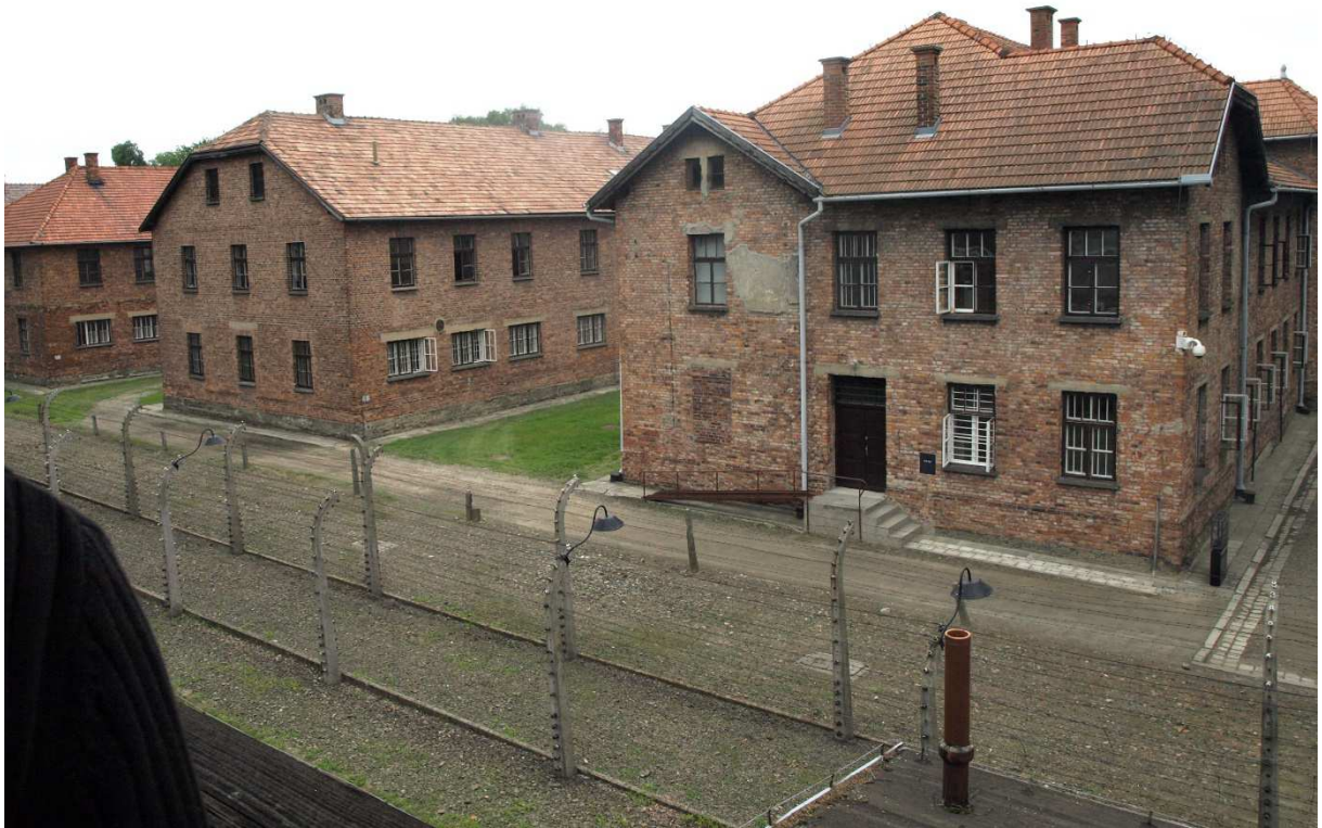
Widok na Auschwitz z wieży wartowniczej