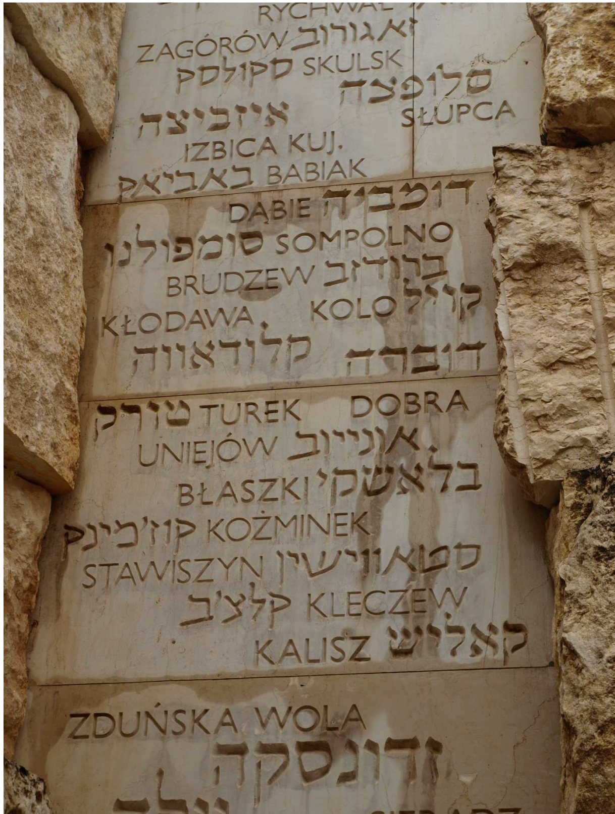
Dolina Gmin z nazwami miejscowości, w których funkcjonowały gminy żydowskie