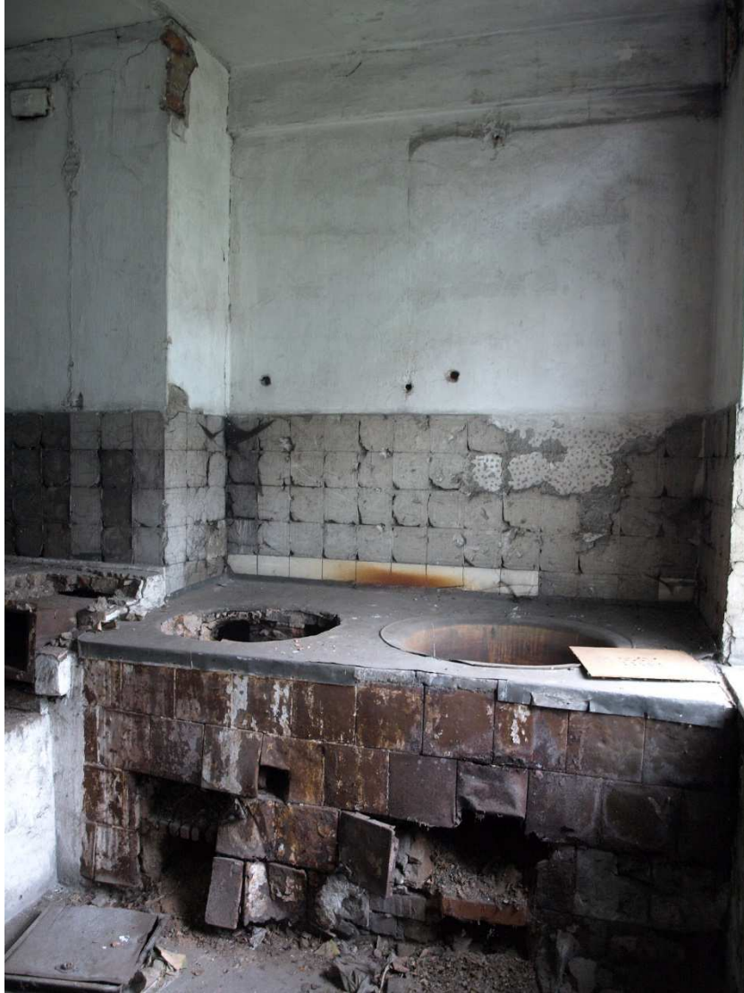
Pozostałości po kuchni obozowej w Auschwitz I