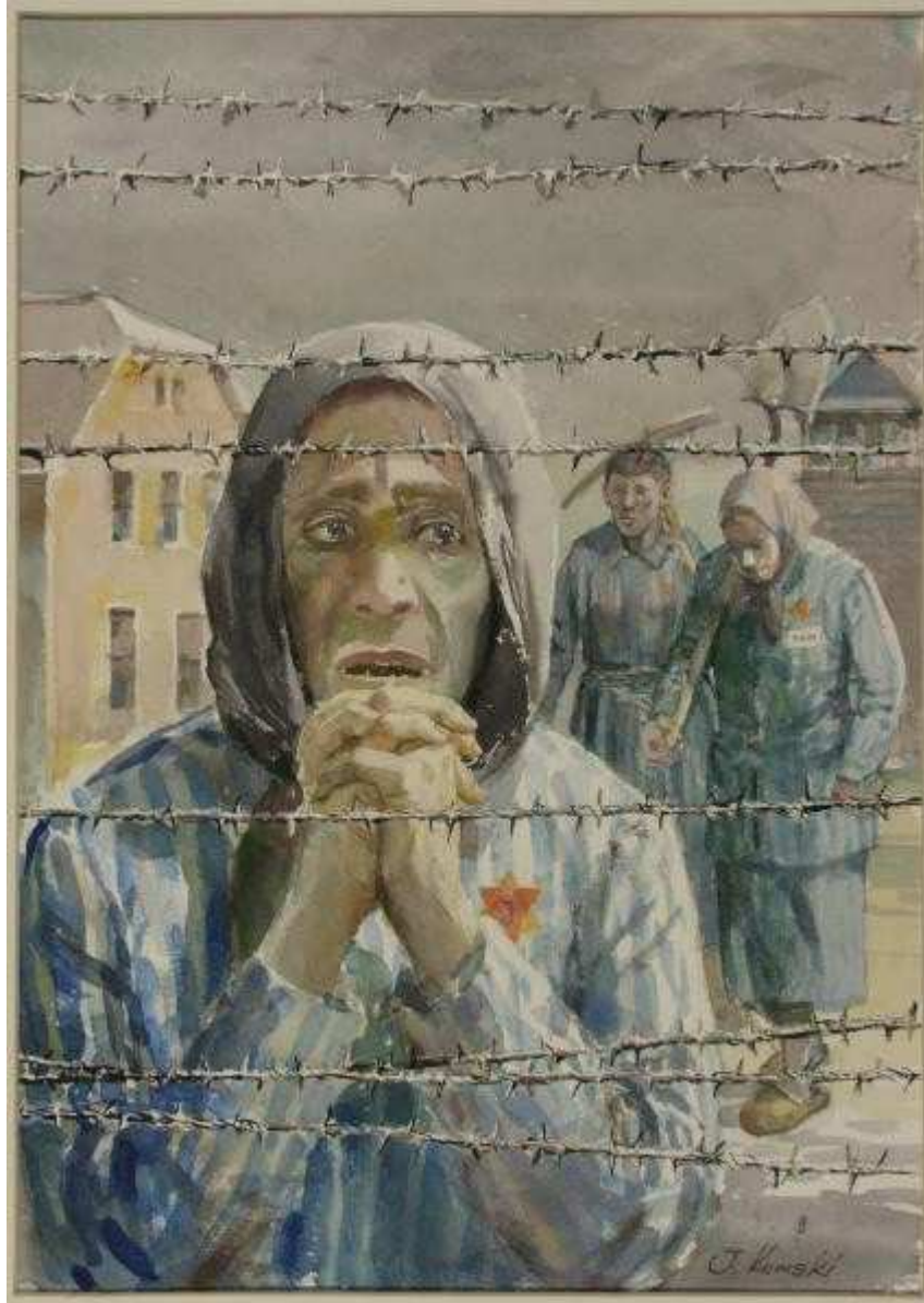
Za drutami - akwarela

Obóz Auschwitz, którego załóżek stanowiły 22 murowane budynki przedwojennych koszar wojskowych, w miarę upływu czasu systematycznie rozrastał się przestrzennie i organizacyjnie. W szczytowym okresie swego rozwoju, latem 1944 r. obóz obejmował około 40 km 2 terenu w bezpośrednim sąsiedztwie, i ponad 40 obozów filialnych rozrzuconych w promieniu kilkuset kilometrów. W tym czasie w kompleksie obozów Auschwitz przebywało około 135 tys. ludzi (105 tys. zarejestrowanych i około 30 tys. niezarejestrowanych), czyli 25% więźniów wszystkich obozów koncentracyjnych (525 tys.). W ostatnich dwóch miesiącach istnienia, po unieruchomieniu w październiku 1944 r. komór gazowych, w związku z krytyczną sytuacją militarną Trzeciej Rzeszy i spodziewaną kolejną ofensywą radziecką, obóz wszedł w stadium ostatecznej likwidacji zakończonej ewakuacją więźniów.