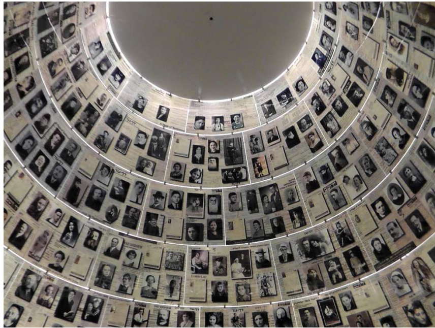
Yad Vashem – Sala Imion