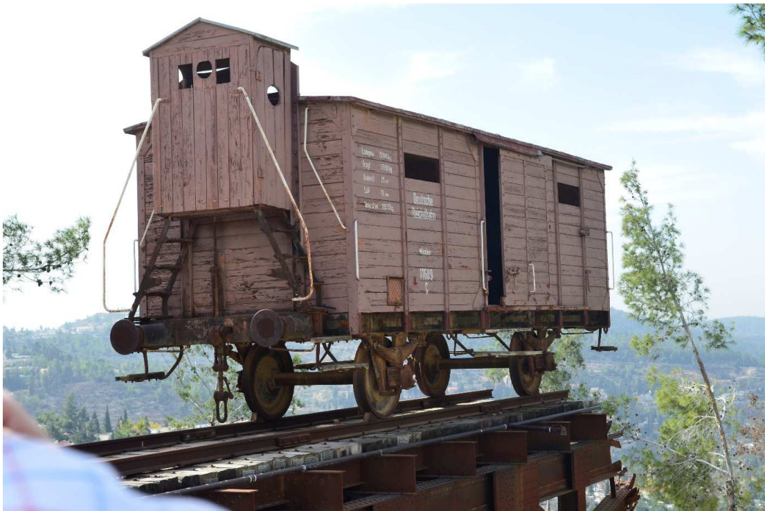
Wagon, w jakim transportowano Żydów do Auschwitz