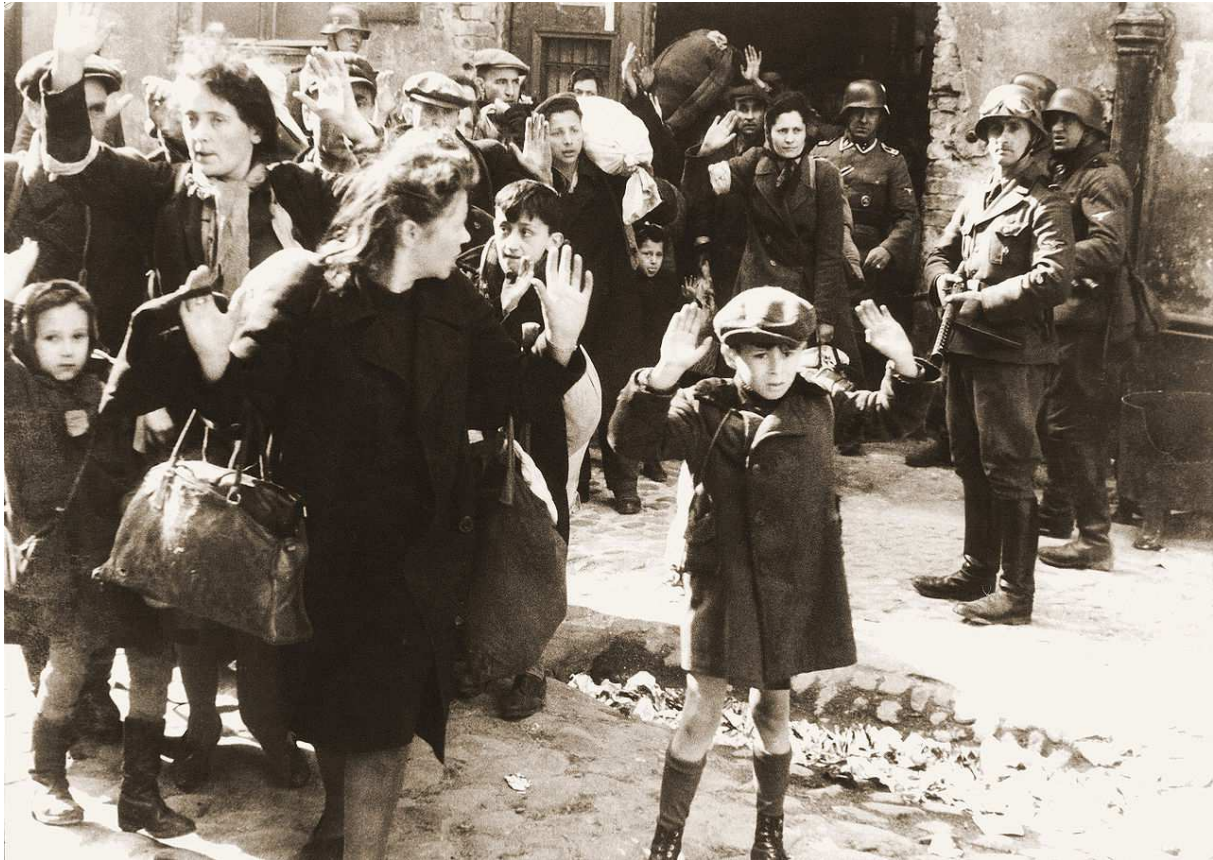
Przygotowywanie Żydów do wywozu do obozu zagłady