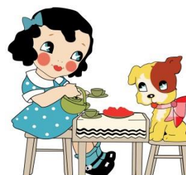
Tamarka a Timo