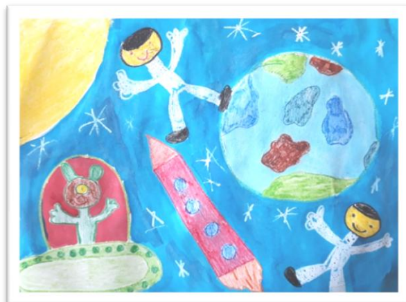
Šarlota Hviščová, III.A