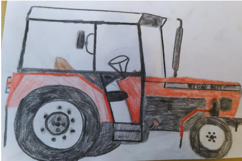
Vojtěch R. (3. ročník)