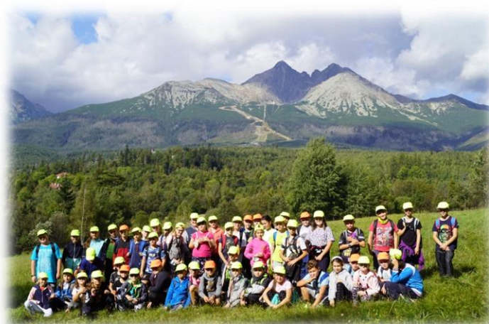
Škola v prírode – Vysoké Tatry