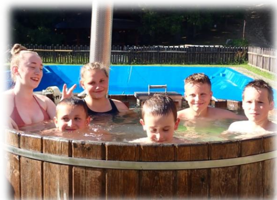
1. 7. – 2. 7. 2020 – Chata Kmínek