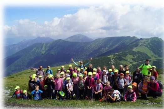
20. 8. 2020 – Veľký Fatranský Kriváň