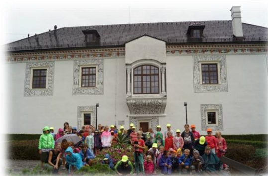
17. 8. 2020 – Súľovské skaly, Palác v Bytči