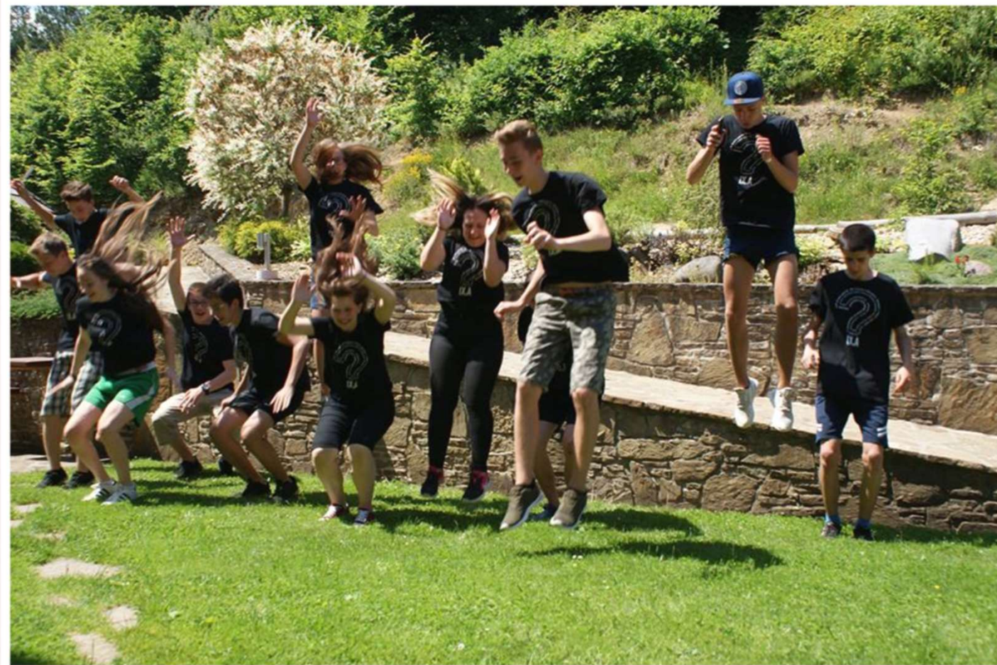
Duchovný výlet 9. A, 2017, Drienica