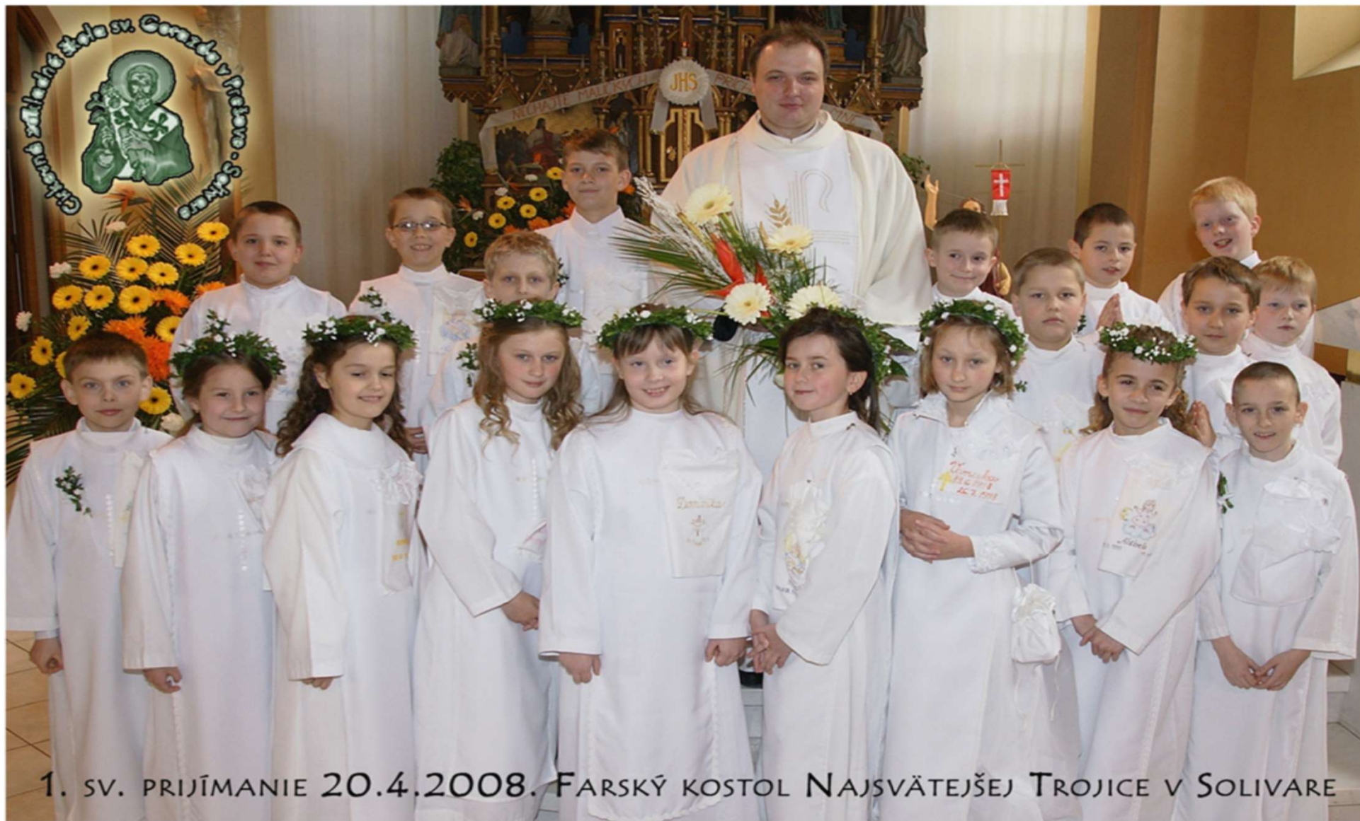
1. SV. PRIJÍMANIE 20.4.2008. FARSKÝ KOSTOL NAJSVÄTEJŠEJ TROJICE V SOLIVARE