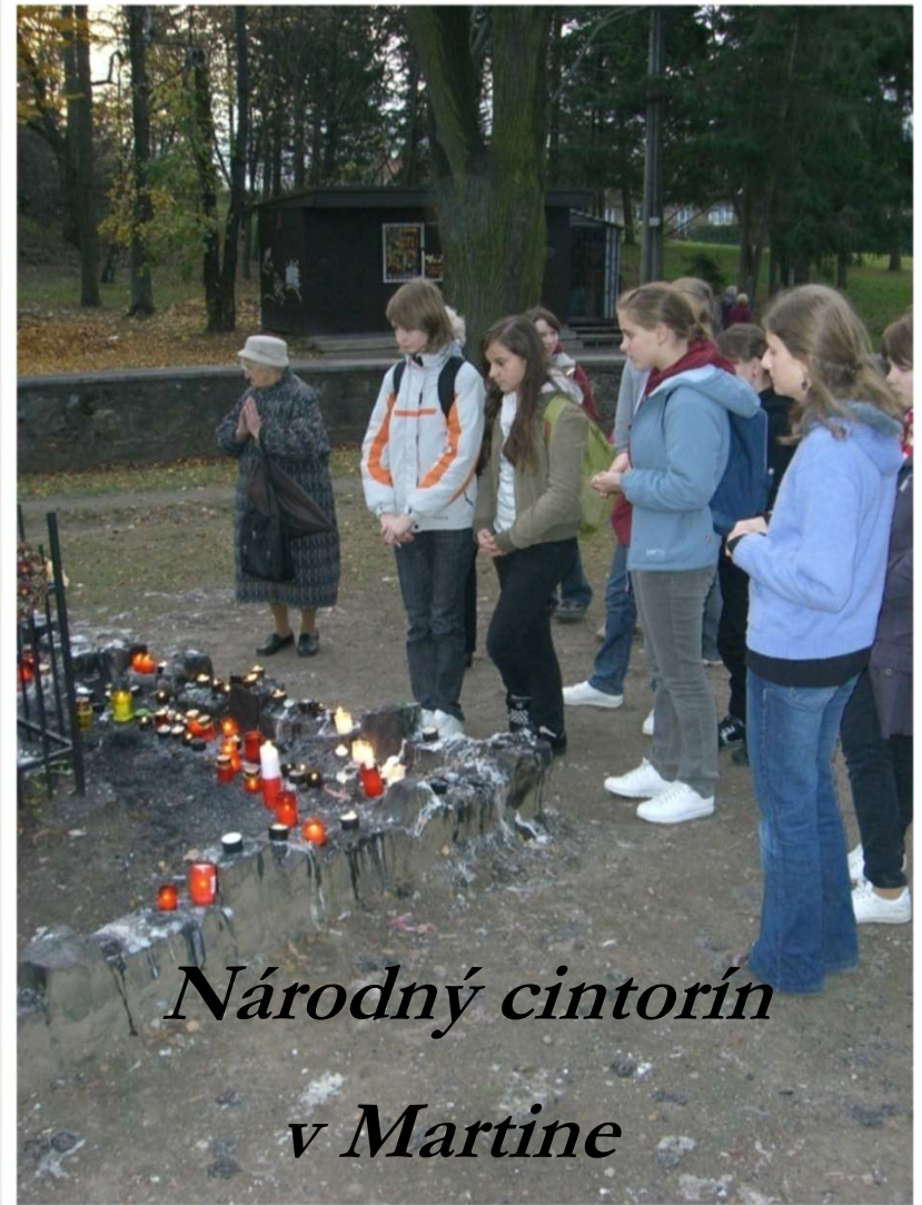
Národný cintorín v Martine

Ani pri potulkách po Slovensku a v zahraničí nezabudneme venovať chvíľku modlitbe.